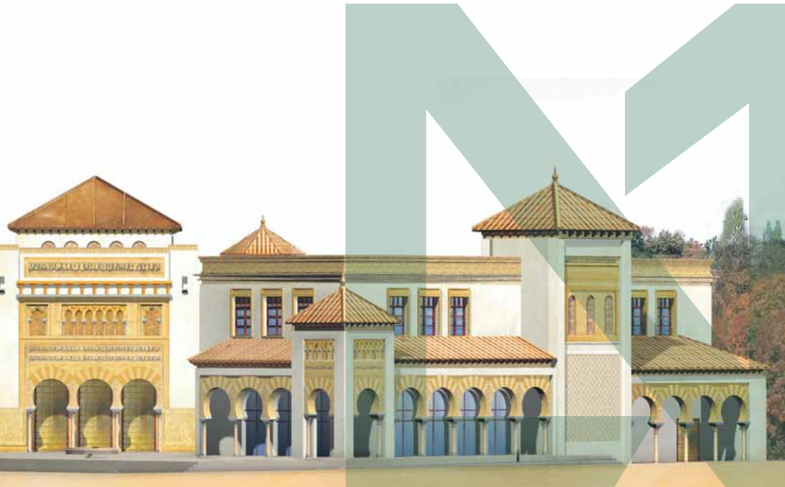
Centro Islámico Málaga. Promotor: Ministerio de Asuntos Islámicos, Reino de Arabia Saudí. Pto: 15 Millones Euros.