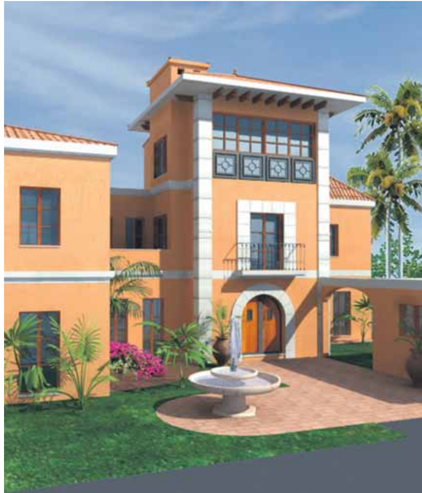
Vivienda-Palacio. Promotor Privado. Riad. Arabia Saudí.

Proceso de auditoría y ensayos que aporta un análisis exhaustivo sobre el cumplimiento de normativas y adecuación a los requerimientos funcionales de las instalaciones y elementos constructivos de un edificio en estado operativo. Descripción de las correcciones y mejoras. Evaluación de las soluciones propuestas.