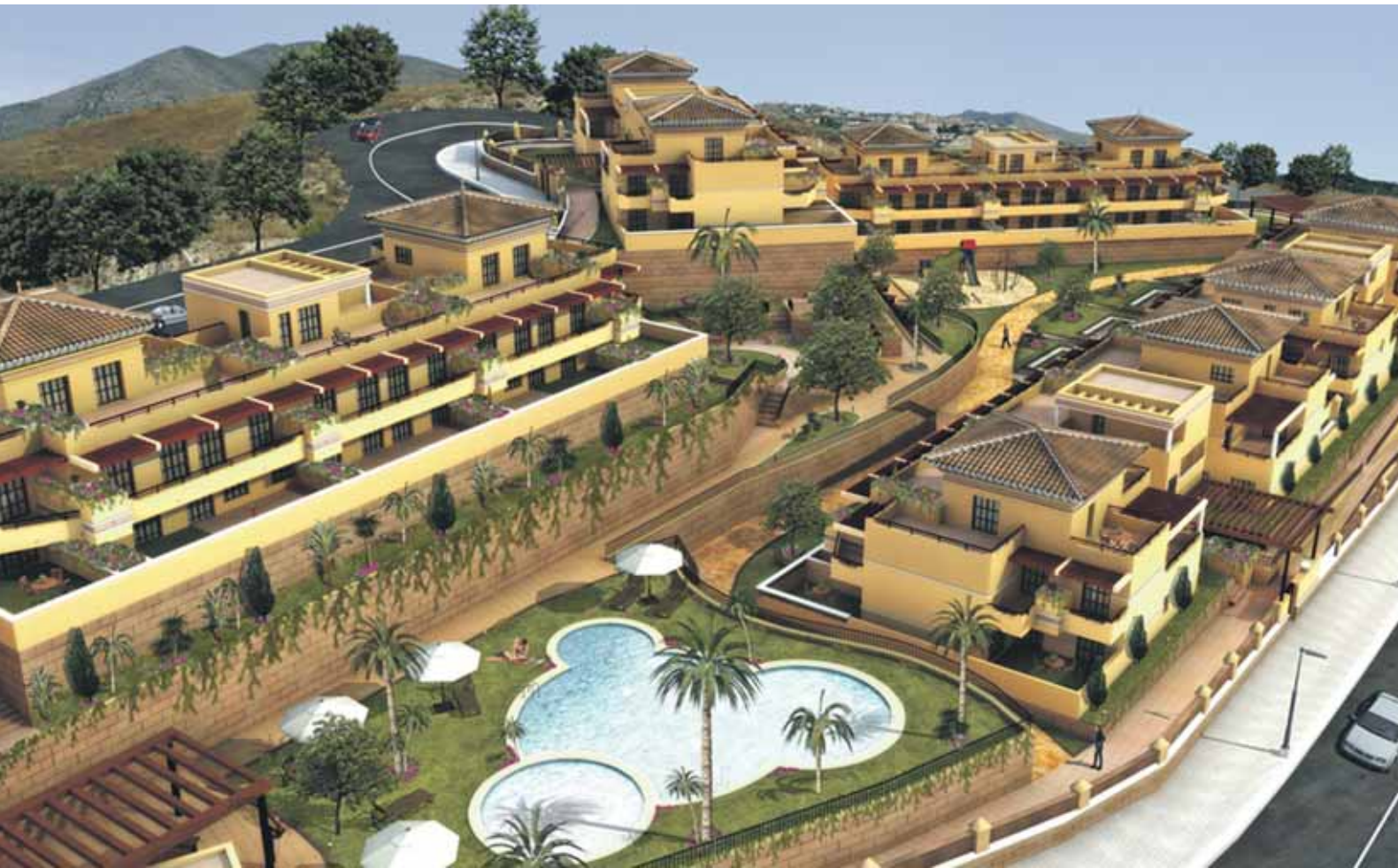
Residencial Brisas de Almayate. Promotor: REYAL. Pto: 8 Millones Euros.