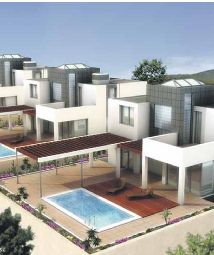
Urb. Los Olivos. Viviendas Unifamiliares. Promotor: Inmobiliaria Marbella S.A. Presupuesto: 2 Millones Euros.