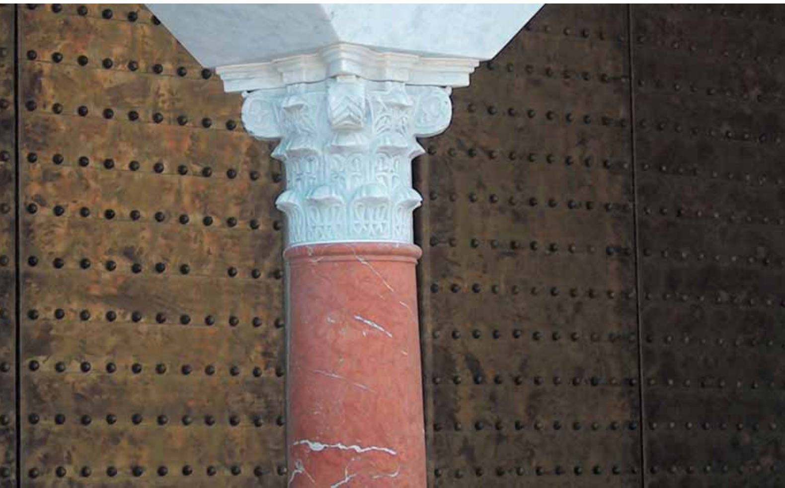
Centro Islámico de Málaga

Detrás de un gran proyecto siempre hay un gran equipo